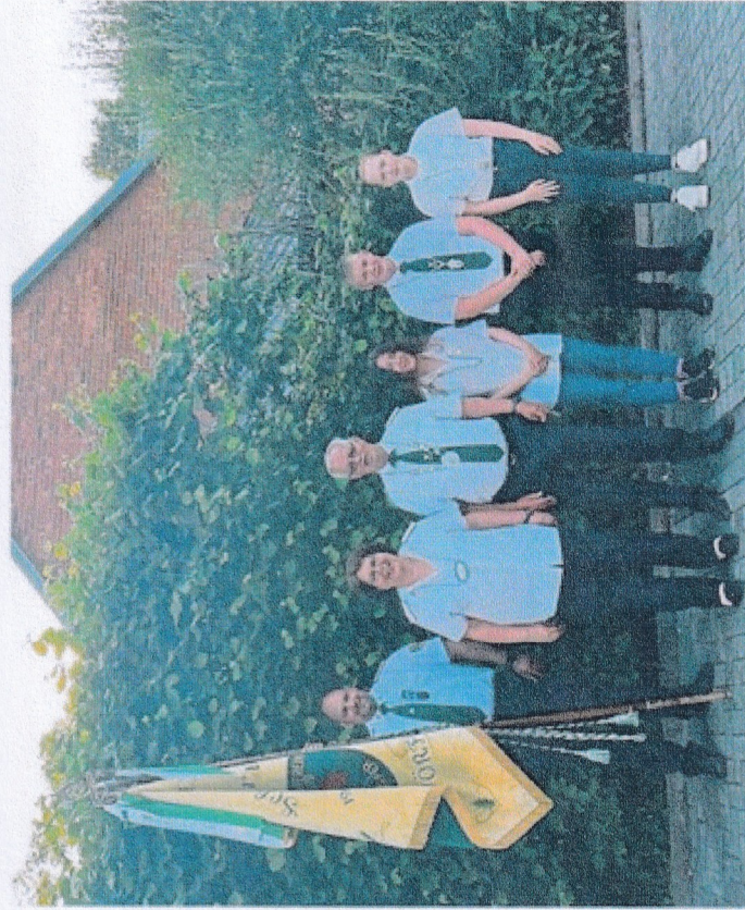
Schon bald tragen andere Majestäten die Königswürde und herrschen über die Wasserdörfer. Ob sie wieder aus einem Haushalt kommen?