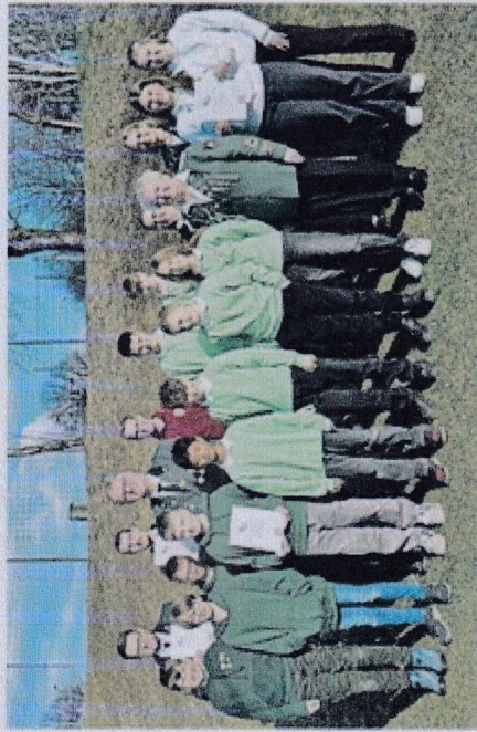
Siegerehrung für die Gewinner des Jugendförderpreises.